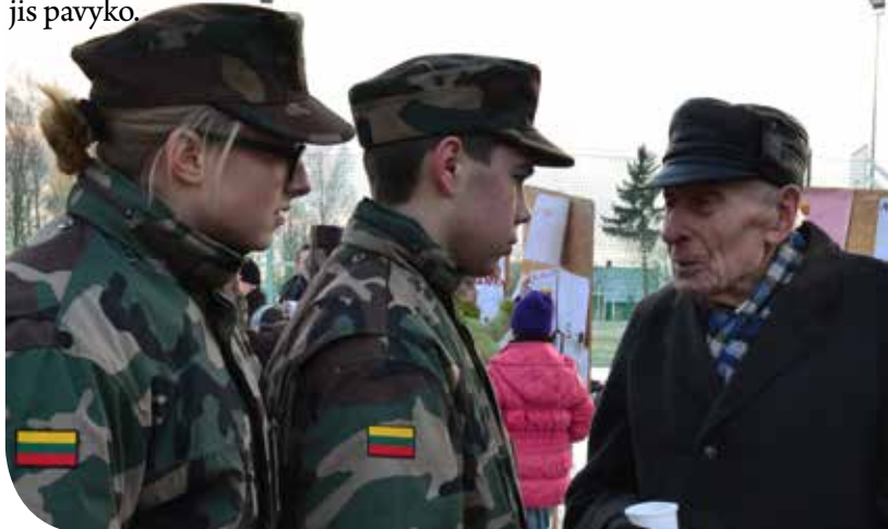
Jauniesiems šauliams įdomios istorinės žinios iš pirmų lūpų

Skirstantis apėmė dvejobas jausmas. Darėsi ir liūdna, ir linksma. Liūdna – kad renginys baigėsi, linksma – kad jis pavyko.