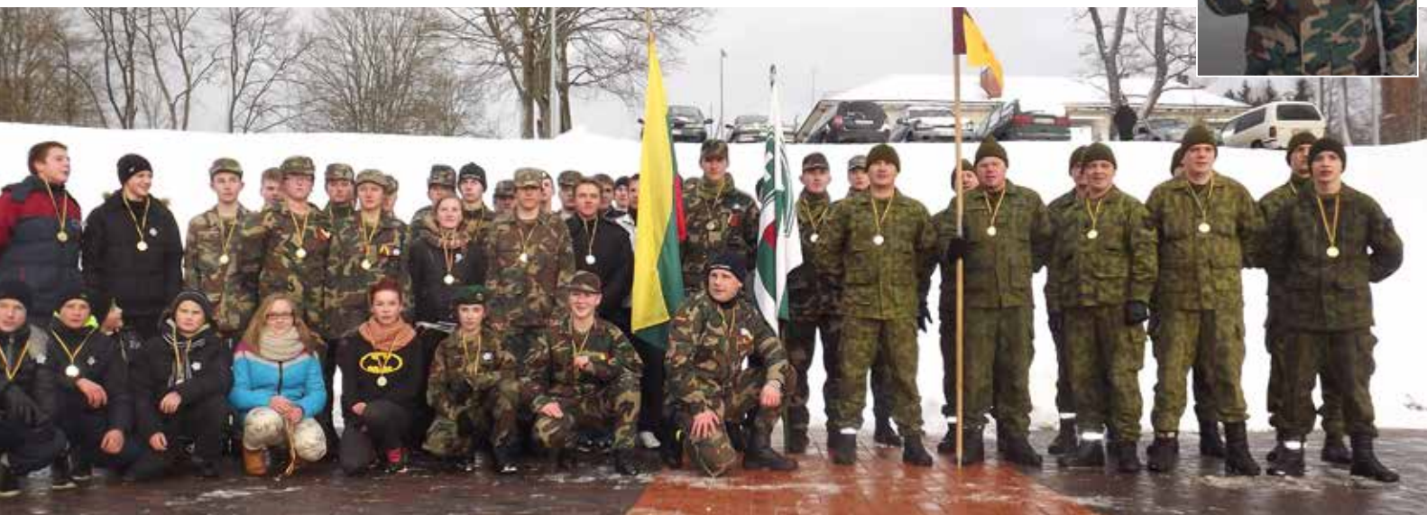
Pradėti bėgimą buvo patikėta mums, šauliams