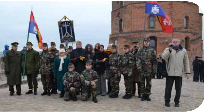
Gedimino bokšto trispalvę saugos vaižantiečiai

Tradiciškai metus Gedimino pilies bokšte plevėsavusi vėliava perduodama saugoti vienai iš Lietuvos mokyklų. 2013 m. Gedimino pilies bokšto trispalvė įteikta Rokiškio Juozo Tumo-Vaižganto gimnazijai. Mokymo įstaigos mokiniai, tarp kurių yra nemažai jaunųjų šaulių, o tiksliau – Rokiškio 9-osios kuopos didžioji dalis jaunųjų šaulių yra šios gimnazijos mokiniai, aktyviai veikę saugojant bei puoselėjant istorinę atmintį: tvarkė ir puošė Rokiškio rajono savanorių kapus, pokario partizanų žūties vietas, organizavo bei dalyvavo daugiau kaip 20 pilietinių bei patriotinių renginių.