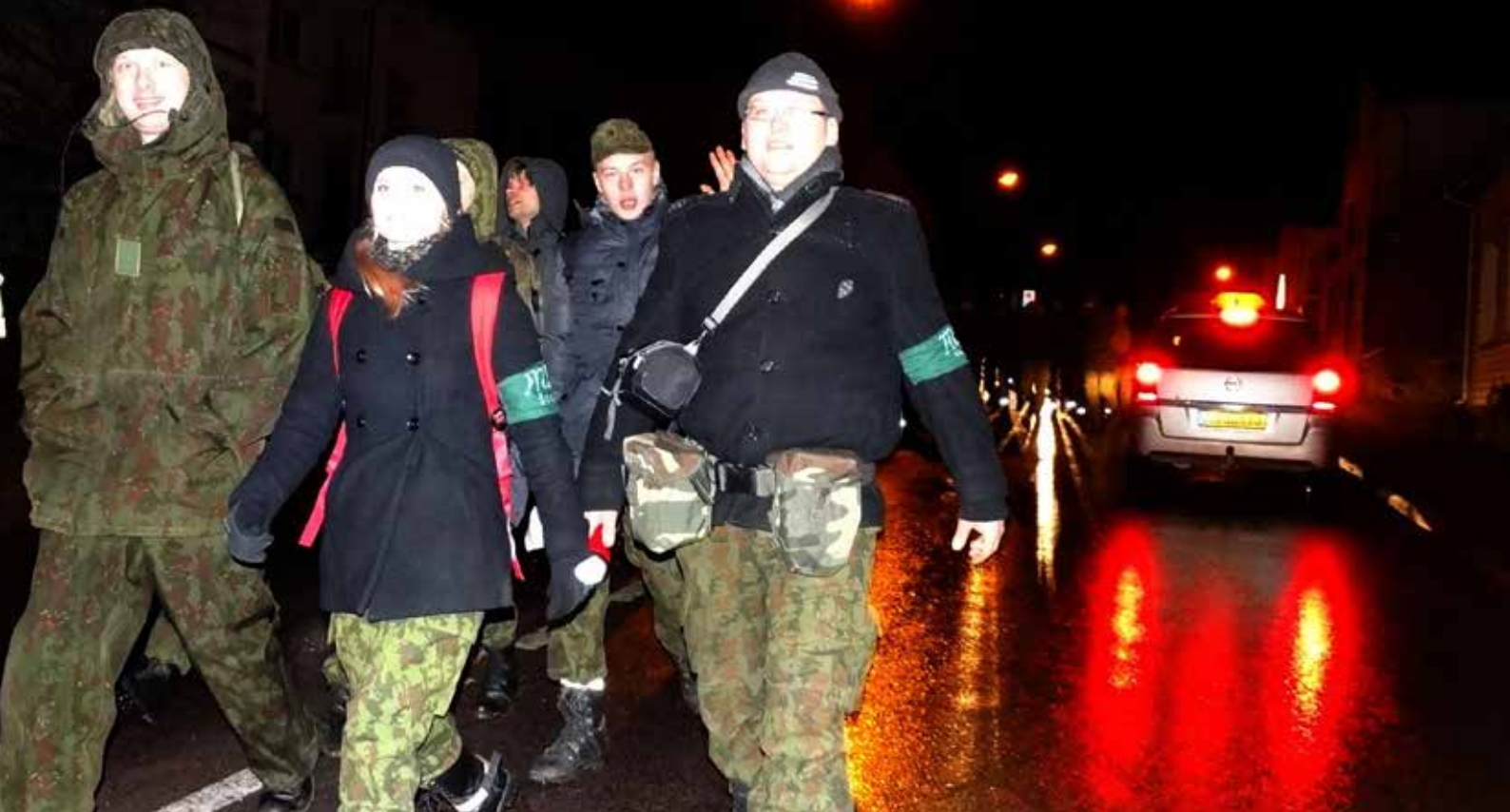
Energijos nepristigome iki paties finišo

25 kilometrų žygis – ne pasivaikščiojimas: finišo liniją turėjome kirsti iki 5 val. 30 min., kitaip žygio neužskaitytų, tad žygiavimo tempas buvo gana spartus. Reikia pripažinti,