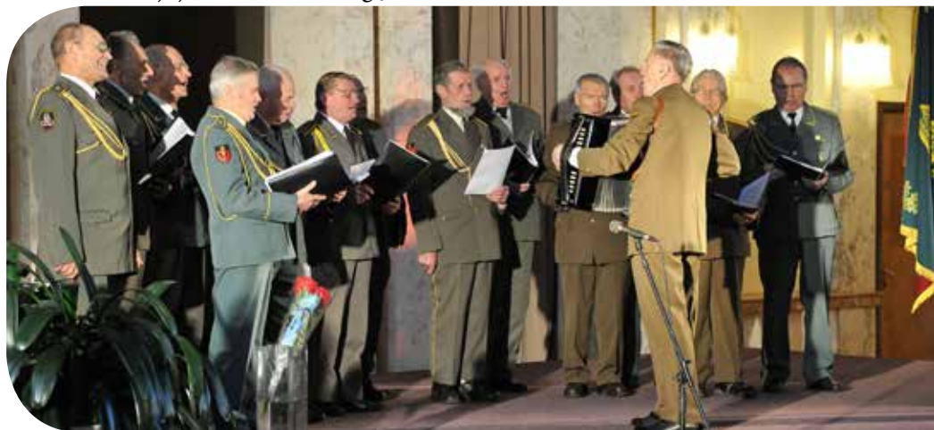
Šaulių ansamblio „Trimitas“ vyrai atliko patriotinių dainų