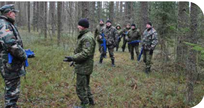
Orientavimosi pratybos: vietovėje ir žemėlapyje

Tuo pat metu, kai jaunieji šauliai sėmėsi žinių kariniuose daliniuose, Div. gen. Stasio Raštikio Lietuvos kariuomenės