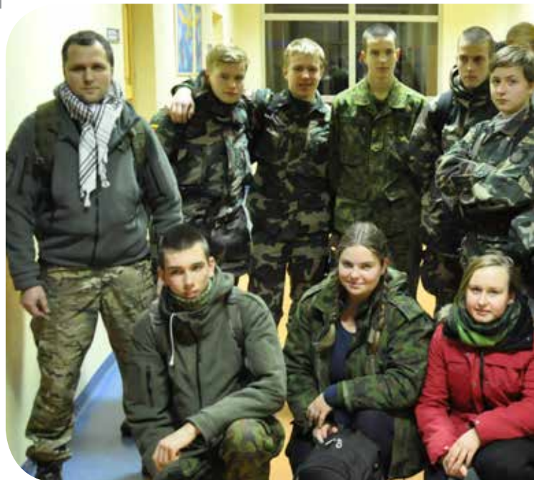
Dalyvausime ir kitąmet!

Šiomet žygio startas – Kretingos Pranciškonų gimnazija, o finišas – Lietuvos didžiojo kunigaikščio Butigeidžio dragūnų batalionas. Taigi po šv. Mišių Kretingos bažnyčio-