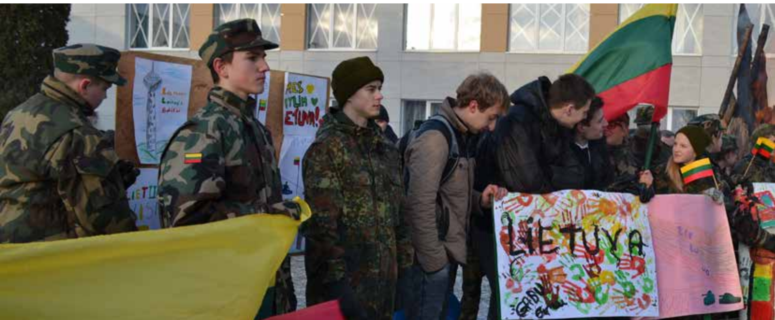
Dalyvauti piešinių parodoje „Sausio 13-oji“ – galimybė pasinerti į to meto įvykius