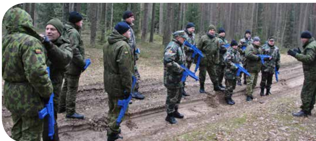
„Kovinė rikiuotė – visuomet svarbi!“ – teigia instruktorius