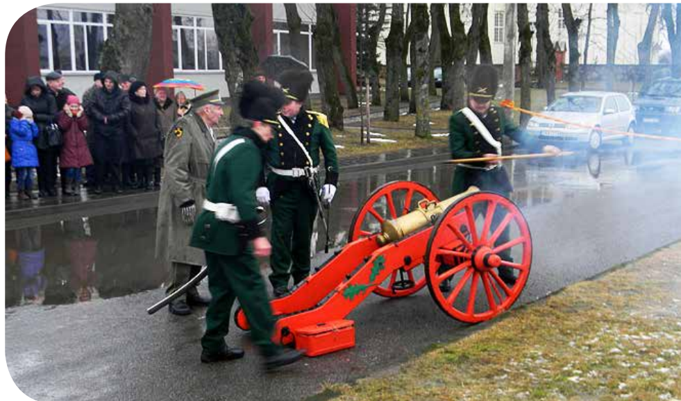
Ypatingą šventę minime garsiai