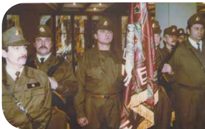
Aukščiausiosios Tarybos apsauga tada buvo svarbiausia šių vyrų pareiga. R. Balceris karėje