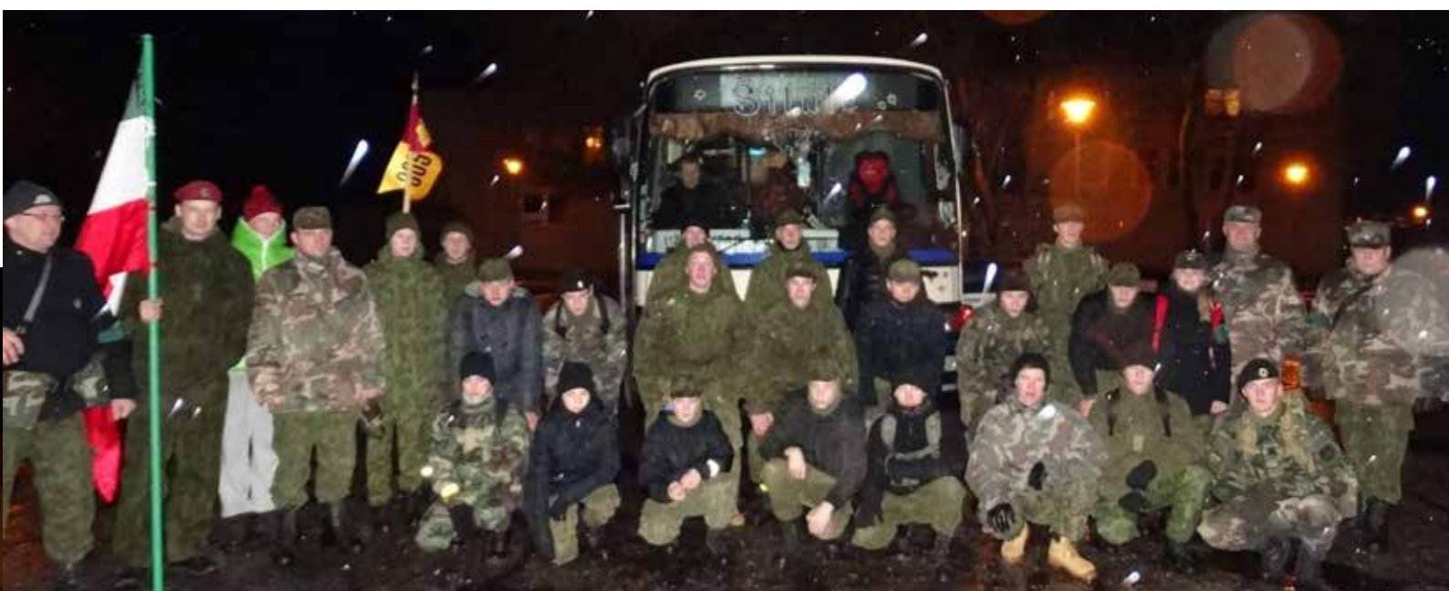
Džiugu, kad visi įveikėme maršrutą be jokių trukdžių ar nesėkmių

Vakarų (jūros) šaulių 3-iosios rinktinės Šilutės šaulių kuopos šaulys