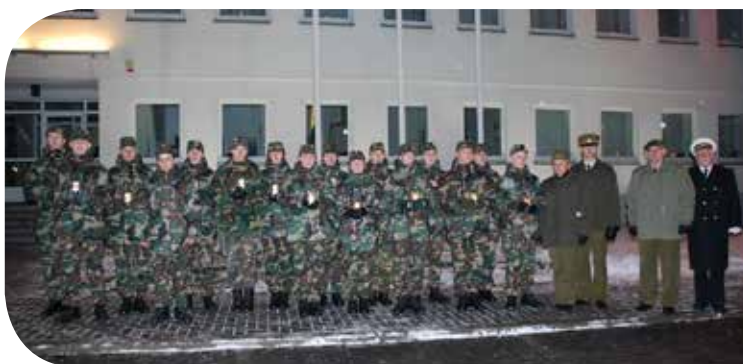
Žemaitijos šauliai atidavė pagarbą žuvusiesiems

liepsnelėms sugiedojome himną, po neilgų pasisakymų susibūrėme prie degančio laužo ir, kaip anuomet Parlamento bei Televizijos bokšto gynėjai, dalijomės karštos arbatos puodeliu ir klausėmės gražaus koncerto. Vėliau visi ėjome į Šv. Antano Paduviečio katedrą, kur aukotos šv. Mišios už visus tėvynės patriotus. ■