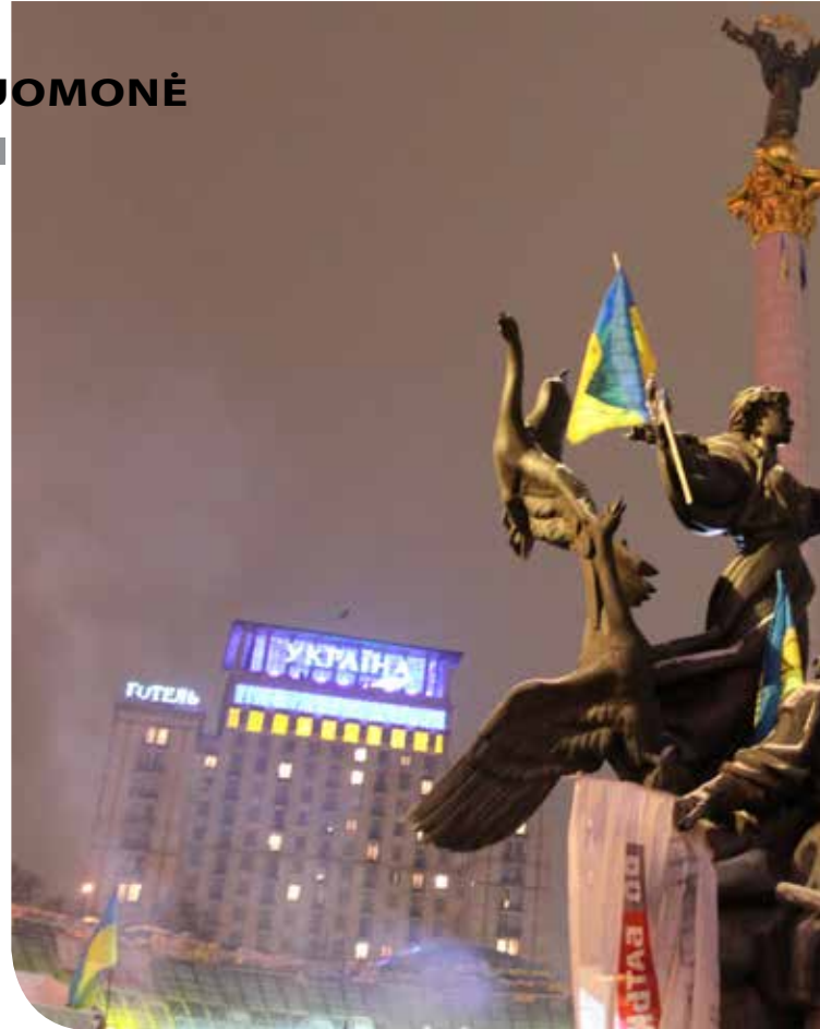
Ukrainos vėliavos ant paminklo Maidane

Pabandykime panarstyti mechanizmus, kuriais pasi-