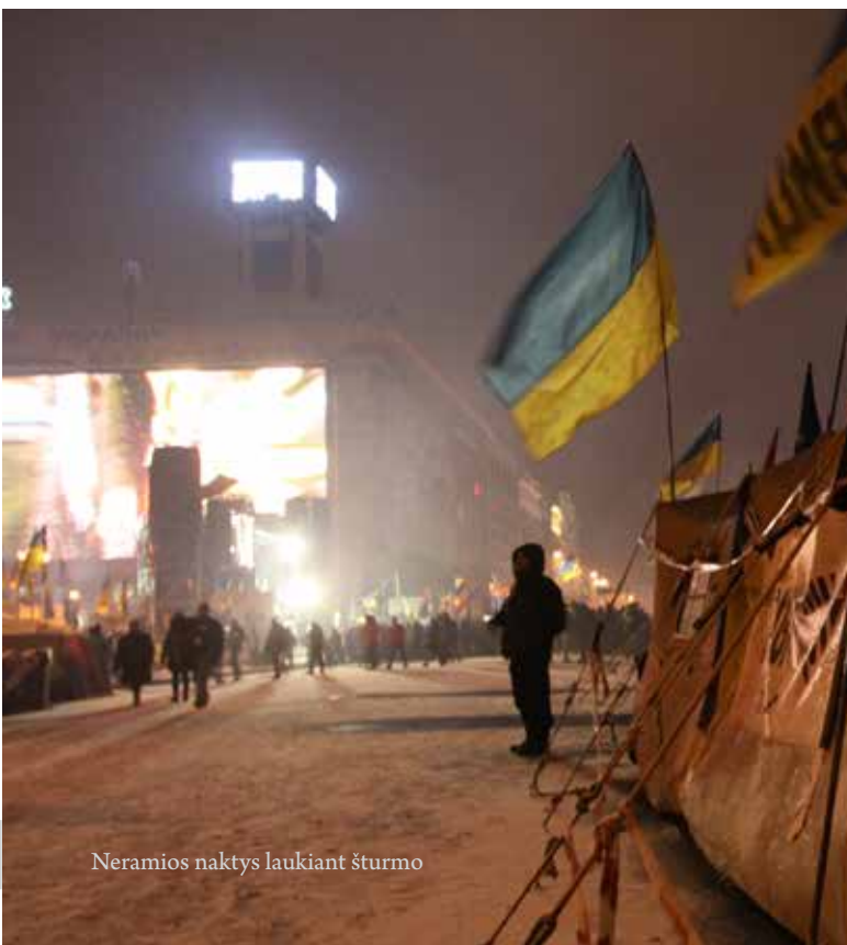
Neramios naktys laukiant šturmo