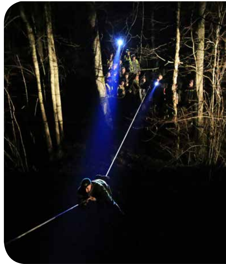
Įveikdamas kliūtis pasitikrini ne tik kūno, bet ir dvasios stiprybę

„Žmonių sąjunga – neįveikiama tvirtovė“, – teigė V. Skostas. Manau, šie žodžiai labai tinka visiems žygio „Pajūrio istorijos takais“ dalyviams, sėkmingai įveikusiems 16 kilometrų ir susipažinusiems su Pajūrio krašto istorija. Esame dėkingi visiems padėjusiems organizuoti žygį ir prisijungusiems prie mūsų iniciatyvos. Iki susitikimo kituose žygiuose!“ ■