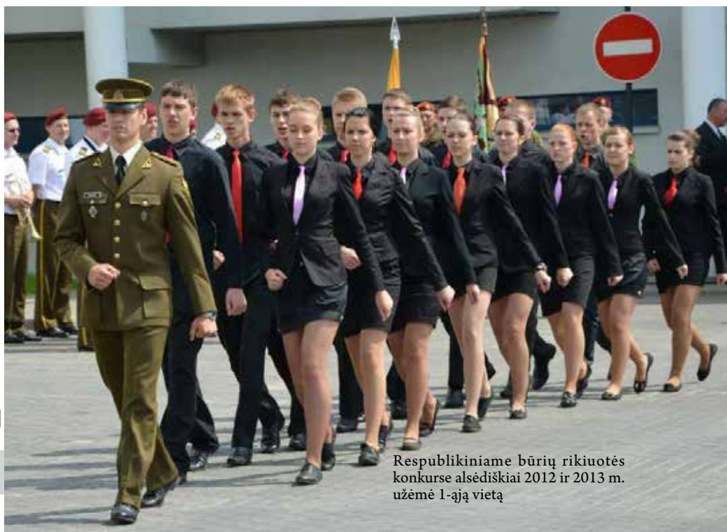
Respublikiniame būrių rikiuotės konkurse alsėdiškiai 2012 ir 2013 m. užėmė 1-ąją vietą

Visados turėjau pavyzdį ar autoritetą, į kurį lygiauvasi, stengiausi tapti ge-