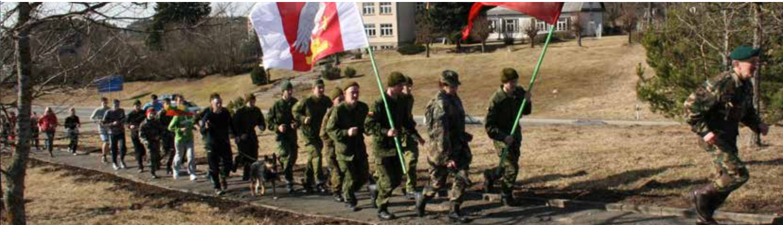
Kovo 11-ąją pasveikinome bėgdami 11 km trasą