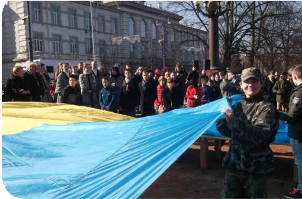
Mums teko garbė laikyti vėliavą

„Laukuvos Norberto Vėliaus gimnazijos jaunieji šauliai po iškilmingo Seimo posėdžio dalyvavo pilietinėje akcijoje Lukiškių aikštėje „Viena širdis“, skirtoje Ukrainos demokratinams siekiams palaikyti bei pagerbti kovotojus už laisvę. Aikštę apjuosėme širdimi, suformuota iš didžiulių Lietuvos ir Ukrainos vėliavų. Mums, jauniems šauliams, kartu su ukrainiečių moksleiviais bei Lietuvos gyventojais teko garbė laikyti didžiąją vėliavą. Namų parsivežėme neišdildomų įspūdžių, kad ir mes galėjome parodyti Ukrainai bei laisvės aukoms savo pagarbą.“ ■