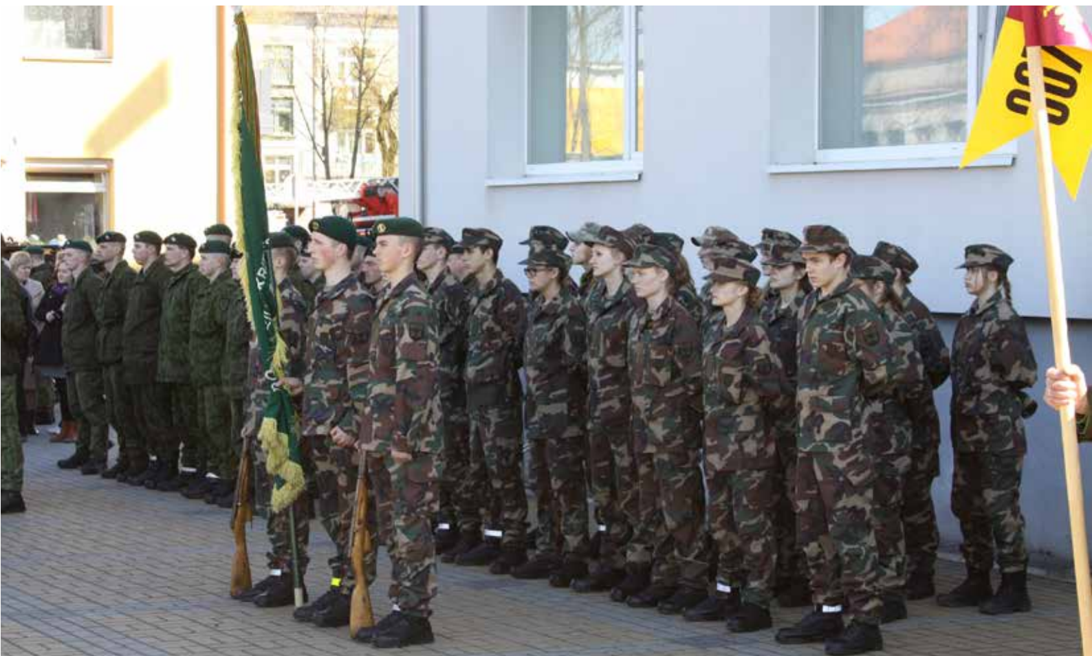
Vienoje rikiuotėje sustoję jaunieji šauliai, kariai ir kariai savanoriai pagerbė vėliavą, sugiedojo himną