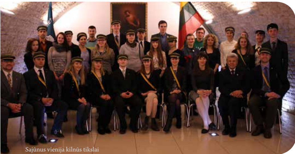
Sajūnus vienija kilnūs tikslai

Kovo 22 d. šaulių studentų korporacija „Saja“ kiek pavėluotai, tačiau labai iškilmingai paminėjo Lietuvos nepriklausomybės atkūrimo dieną jau tradicija tampančiu renginiu „Gyva. Nepriklausoma. Laisva...“ Renginio metu sveikinimo žodį tarė naujoji „Sajos“ pirmininkė, kurią išrinko prieš tai posėdžiavęs neeilinis visuotinis susirinkimas.