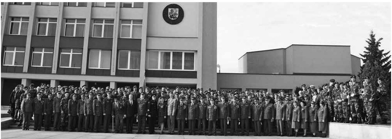
Rinktinės broliai ir sesės šauliai su draugais bei bičiuliais

„Trimito“ informacija