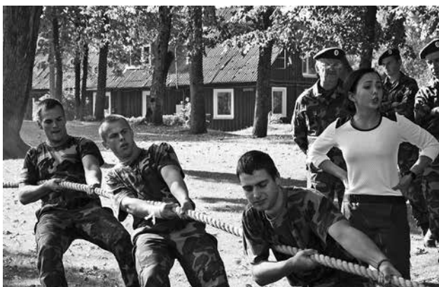
Virvės traukimas – tradicinė šaulių rungtis