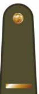
Skyriaus vado pavaduotojas