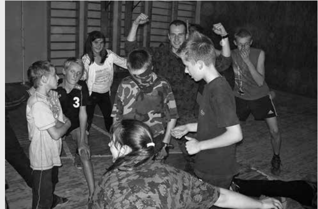
Tikimės, kad dar ne kartą dalyvausime panašiose pratybose

Paskutinį rugsėjo savaitgalį Kalesninkų pagrindinėje mokykloje vyko Karaliaus Mindaugo šaulių 10-osios rinktinės Šalčininkų 11-osios kuopos lauko pratybos. Jose dalyvavo septyniasdešimt jaunųjų šaulių ir kandidatų į jaunuosius šaulius. Suskirstyti į pažengusiuosius ir mažiau pažengusiuosius dalyviai rungtyniavo sporto varžybose, ėjo į naktinį žygį. Daugiau patyrusieji didžiąją laiko dalį praleido atlikdami taktinius manevrus netoliese esančiame miške, miegojo prie mokyklos stovėjusioje palapinėje. Vakare visi smagiai leidome laiką prie laužo, linksmiai bendravome, o sekmadienio ryte kupini teigiamų emocijų vykome namo.