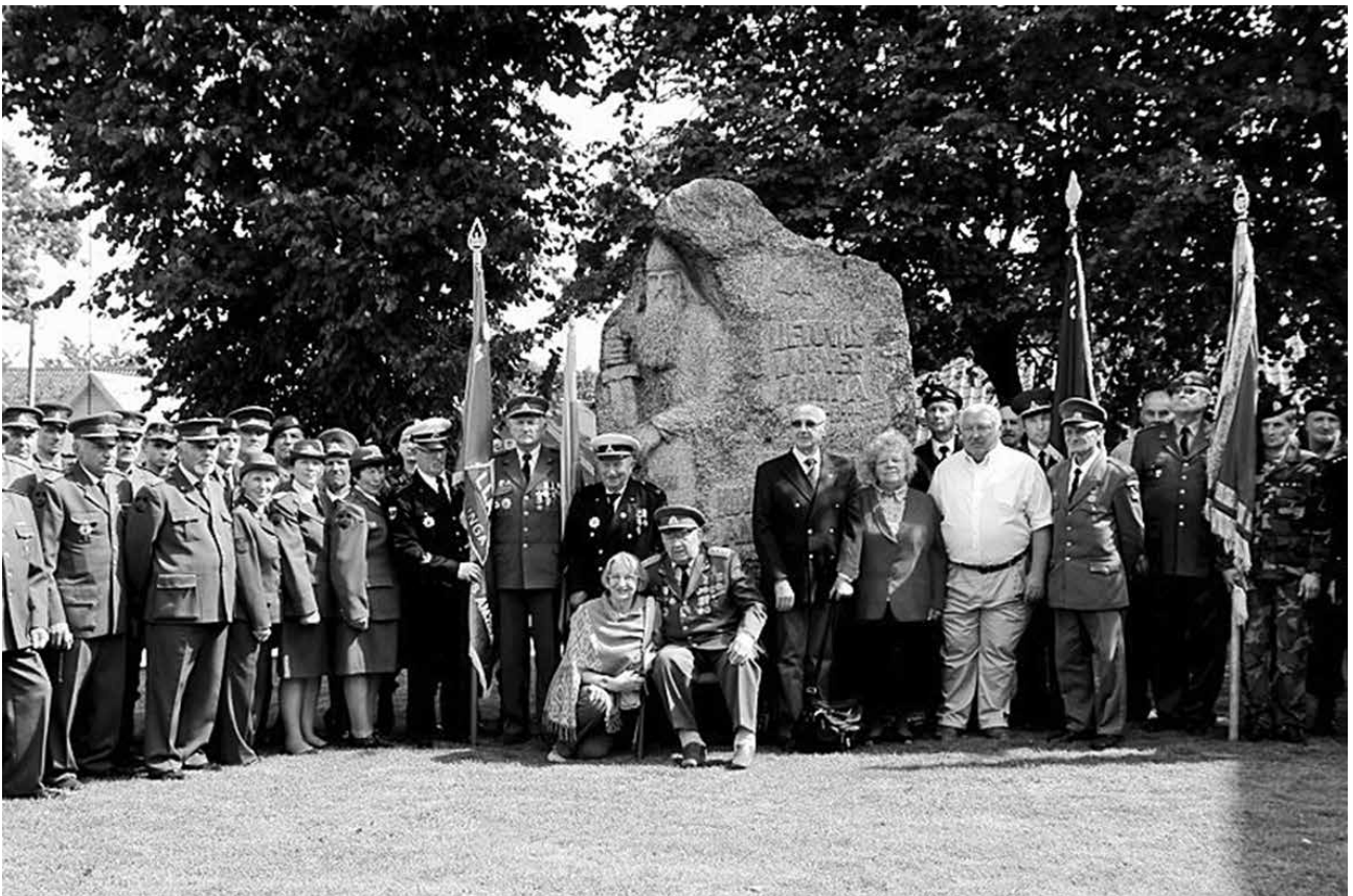
Šventės dalyviai prie paminklo, skirto Lietuvos laisvės armijai