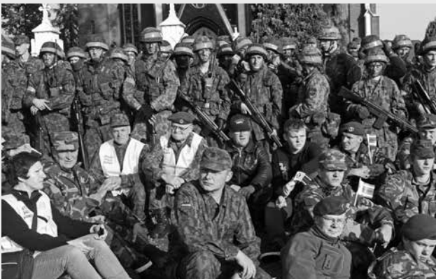
Taktinėse karinėse ir ekstremalių situacijų valdymo ginkluoto konflikto pratybose dalyvavo per 60 šaulių

Rugsėjo pabaigoje Šilalės mieste ir jos apylinkėse vyko taktinės karinės ir ekstremalių situacijų valdymo ginkluoto konflikto metu pratybos „Vilko šuolis. Laiko ašis“, kuriose dalyvavo apie 500 karių. Pratybas organizavo mechanizuotosios pėstininkų brigados „Geležinis vilkas“ Lietuvos didžiojo kunigaikščio Kęstučio mechanizuotasis pėstininkų batalionas, Krašto apsaugos savanorių pajėgų Žemaičių apygardos 3-ioji rinktinė, Lietuvos karo policija kartu su Šilalės rajono savivaldybe. Karinėse pratybose taip pat dalyvavo Tauragės priešgaisrinės gelbėjimo valdybos Šilalės priešgaisrinės gelbėjimo tarnybos atstovai, Šilalės policijos komisariato