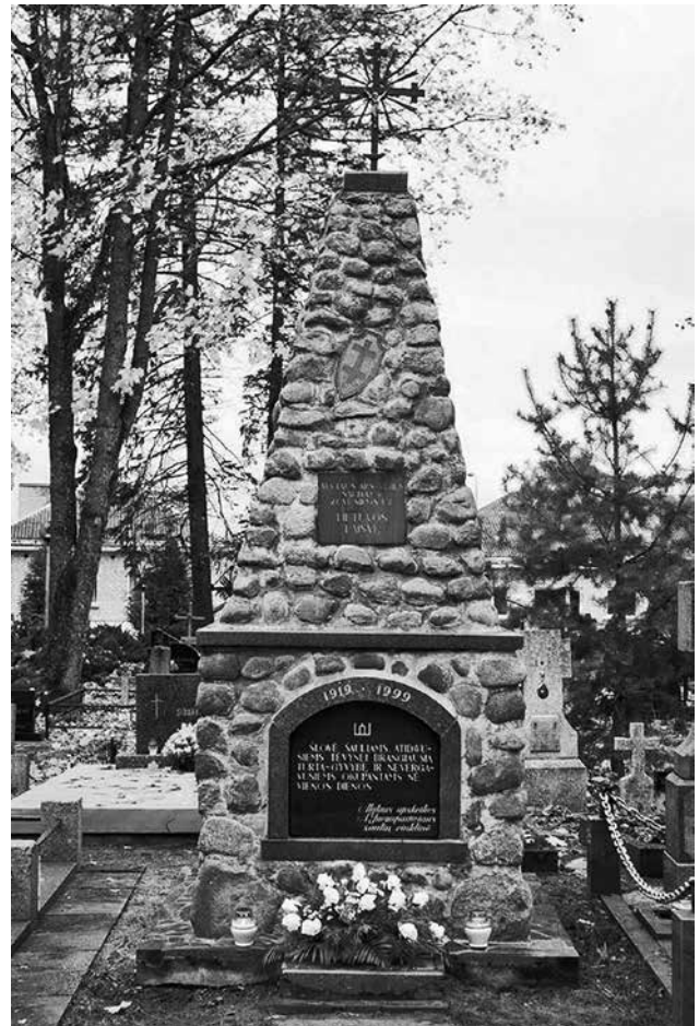
Prie paminklo šauliams sužydo gėlės

buvo perregistruoti 567 šauliai, o 1939 m. sausio 1 d. jų buvo 2 243. 1940-aisiais rinktinę sudarė 60 šaulių būrių. Tragiškas likimas laukė šaulių tais metais – išduota Lietuvos kariuomenė, likimo valiai palikta Šaulių sąjunga. Iš pradžių ji nuginkluojama, vėliau uždraudžiama ir likviduojama. Iki karo pradžios suimta, įkalinta, išstremta apie 70 proc. šaulių, daug jų nužudyta. Nemažai šios organizacijos narių dalyvavo 1941 m. birželio sukilime ir žuvo nuo vokiečių okupantų kulų. Daug šaulių dalyvavo ginkluotoje partizaninėje kovoje pokario metais, dauguma jų paaukojo gyvybes ant Tėvynės aukuro.