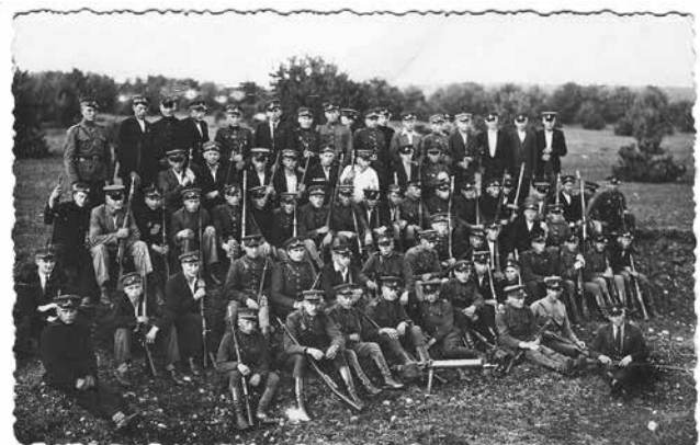
Alytaus šauliai po pratybų, 1937