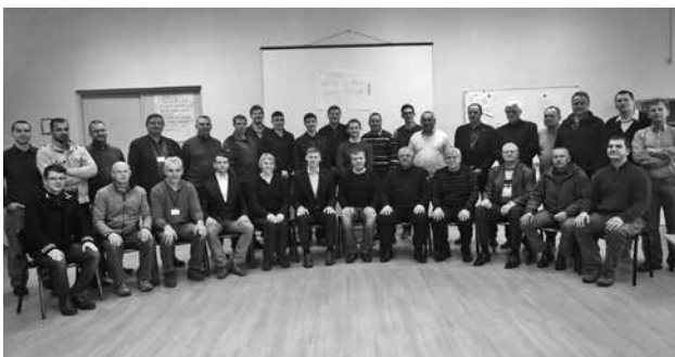
Sesijoje šauliai diskutavo apie Sąjungos strategiją