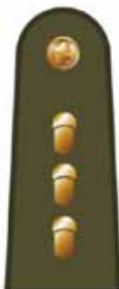
Rinktinės vado pavaduotojas