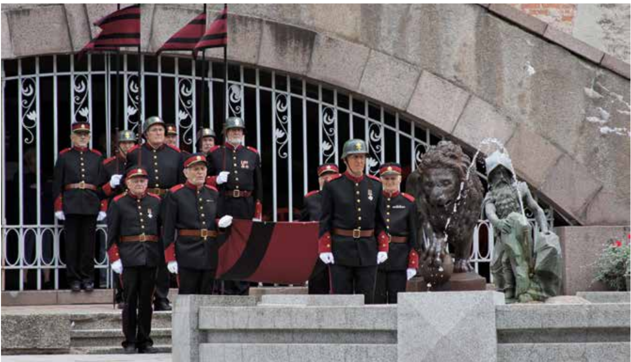
Nuo gegužės iki rugsėjo pabaigos šauliai Vyčio Kryžiaus vėliavą kelia ir savaitgaliais