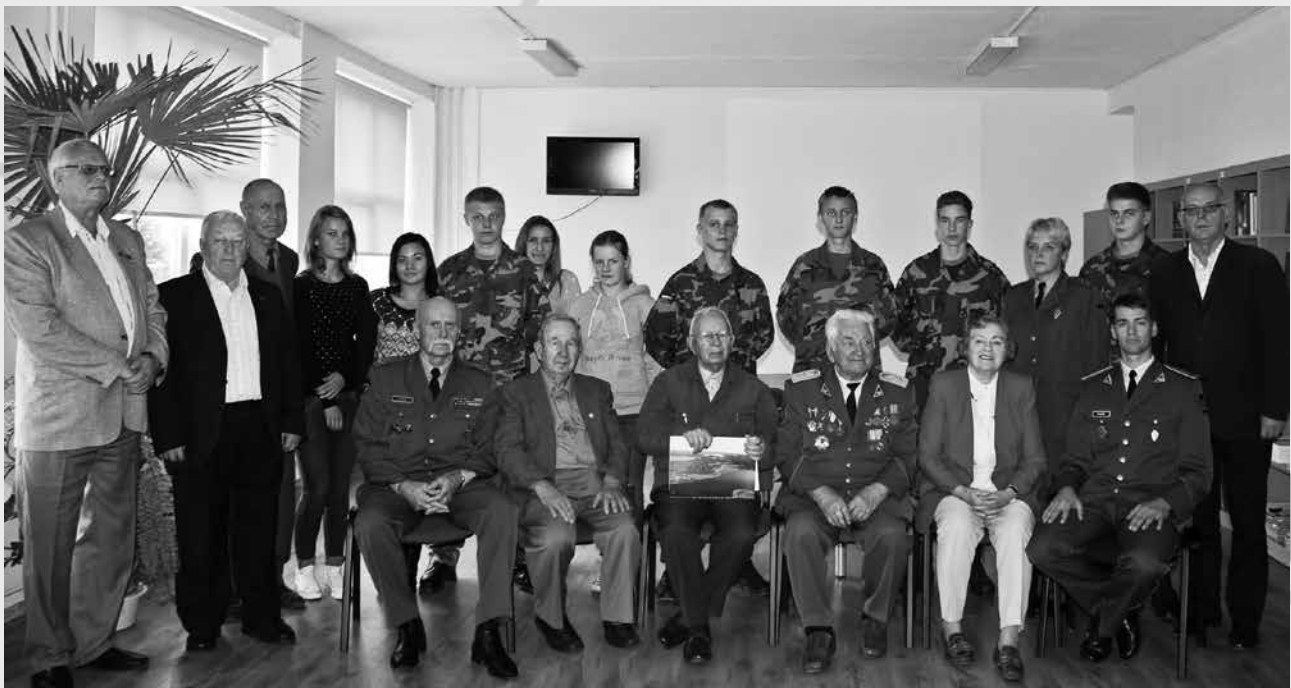
Susitikimas buvo ne tik įdomus, bet ir vertingas

Tokiam pasakojimui neprilygsta jokie filmai ar perskaitytos knygos, tad jaunimas atidžiai klausėsi apie pokario žiaurumus, pasiaukojamą partizanų kovą prieš sovietinius okupantus ir jų talkininkus.