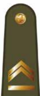
Būrio vado pavaduotojas (būrininkas)