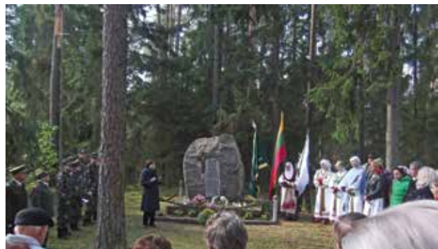
Pušynės miške paminėjome partizanų žūties 70-ąsias metines