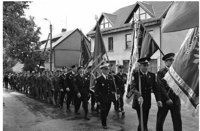
Šventinė eisena žengė per Platelius

Prieš altorių Platelių bažnyčioje išsirikiavo vėliavų miškas. Pasimeldę už žuvusius kovotojus šventės dalyviai nuvyko į miestelio centrą prie paminklo LLA. Sugiedojus tautos himną, tylos minute pagerbti žuvusieji už Tėvynės laisvę. Nuaidėjo trys salvės: už Lietuvą, už žuvusiuosius, už LLA „Vanagų“. Minėjime dalyvavo