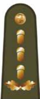
LŠS vado pavaduotojas