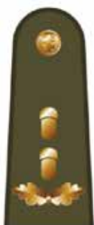
LŠS vado pavaduotojas, jaunųjų šaulių vadas