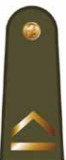
Skyriaus vadas (skyrininkas)