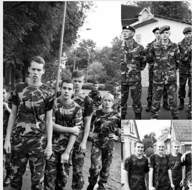
LDK Kęstučio šaulių 7-oji rinktinė – tai stipriai suspaustas kumštis

Latvijos bei Estijos jaunimas buvo tokie pat ryžtingi, pasitempę ir nusiteikę laimėti kaip ir mes. Pirmiausia startavome NATO standartizuotame kliūčių ruože. Iš 12 rungtyniausių komandų jaunųjų grupė liko ketvirta, o vyresniųjų – šešta. Jaunimas nenuleido rankų ir stengėsi kuo geriau pasirodyti orientaciniame bėgime su kliūtimis. O rungtys buvo išradingos: žygis per upę, automobilio stūmimas, ėjimas trosu dviese, tako perėjimas naudojantis keturiomis plokštėmis, barjerinis bėgimas per vandenį, perėjimas nuo vienos paletės iki kitos noliečiant žemės, naudojantis tik draugo petimi ar kartimi, ėjimas slidėmis (visa komanda) ir kt. Užduotys nebuvo lengvos, tačiau mums, šauliams, išmokusiems veikti drauge bei jausti draugo petį, jos netapo neįveikiamomis. Nors, reikia pasakyti tiesą, tapo savotišku sa-