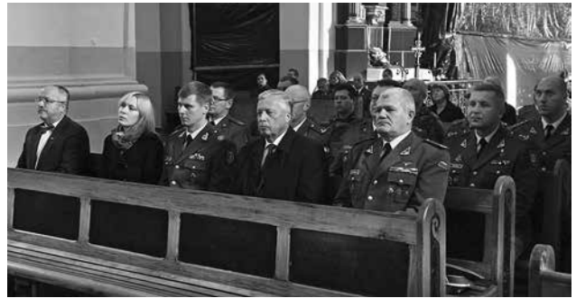
Marijampolės Šv. arkangelo Mykolo bazilikoje už šaulius aukotos šv. Mišios

Rinktinės šventė – visų mūsų šventė. Šauliškai sėkmei reikia daugelio dalykų: patirties, drąsos, išminties, sumanumo ir iniciatyvos. Būtent tokie yra šauliai. Privalome tikėti, kad kiekvieno nuoširdus darbas gali duoti vaisių. Turime suvokti, kad už mus mūsų darbų niekas neatliks, o dirbdami susitelkę galime padaryti labai daug. Turbūt visi sutiks, jog sudėtingos aplinkybės daugeliui žmonių, taip pat ir šauliams, gali būti ne praradimo, o naujų galimybių metas. Nors ir tenka patirti nemažai sunkumų, juos įveikdami tampame stiprūs. Sunku pasverti ir įvertinti, kiek esame svarbūs šiandien ir dabar... Tik atlikti darbai, įgyvendintos idėjos mus patikrina ir įvertina.