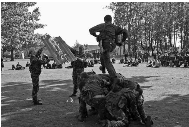
Istabus jaunujų šaulių žvalgų pasirodymas