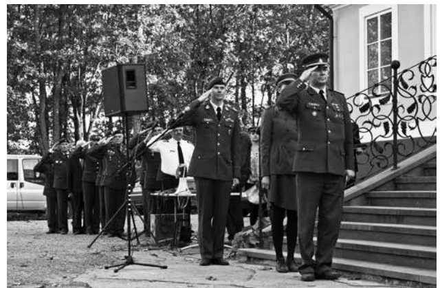
Iškilminga rikiuotė Kelmės dvaro parke

Kadangi įdomu buvo sužinoti, kaip dalyvavusie-