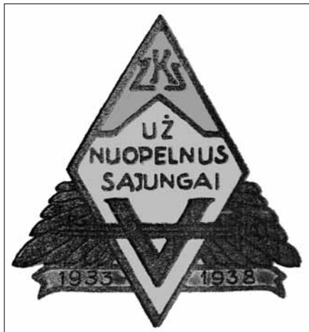
14 pav. Žydų karių, dalyvavusių Lietuvos nepriklausomybės atvadavime, sąjungos ženklas „Už nuopelnus Sąjungai“. 1938 m. Pažadėtoji žemė – Lietuva: Lietuvos žydai kuriant valstybę 1918–1940 m. Sudarytojas Vilius Kavaliauskas. Vilnius, 2013, p. 208, 211