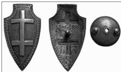
1.2 pav. Lietuvos šaulių sąjungos ženklas. Nešiojamas rikiuotėje. 1925 m. pavyzdžio. Nr. 8881. Dydis – 50 x 28 mm LNM, M 5369