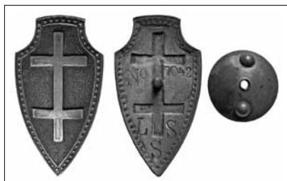
1.1 pav. Lietuvos šaulių sąjungos ženklas. Nešiojamas rikiuotėje. 1921 m. pavyzdžio. Nr. 7042. Dydis – 51 x 27 mm LNM, M 5973

klų 35 . Tačiau lieka neaišku, kada buvo pradėti gaminti 52,5 x 29 mm dydžio ženklai, kurių skydo apvade buvo 56 taškai, numeris – .../...N, įrašas – LŠS, veržlėlė – su raidėmis L.K.I.Š.K. (1.3 pav.). Lietuvos karo invalidų dirbtuvės raidėmis L.K.I.Š.K. sraigtelius pradėjo ženklinti tik nuo 1932 m., tačiau spaudoje apie naujai išleistus ženklus jokių pranešimų aptikti nepavyko. Pažymėtina, kad nors visi išvardyti požymiai ir yra būdingi kiekvienai iš trijų ženklų laidų, kartais pasitaiko išimčių – dydžio, taškų skaičiaus, numerių ar raidžių įkalimo būdo neatitikimo. Visų ženklų skiriamuosius bruožus matome lentelėje (1 lentelė).