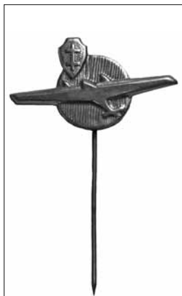
7 pav. Šaulių aviacijos ženklelis. 1937 m. Dail. J. J. Burba. Dydis – 19 x 34 mm LNM, M 5329