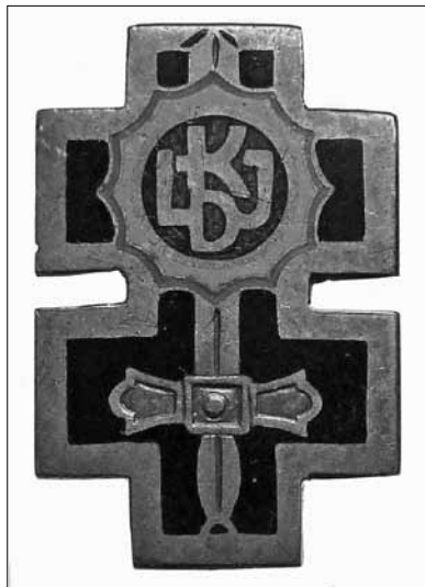
12 pav. Lietuvos laisvės kovų invalidų draugijos ženklelis. 1938 m. Dydis – 22 x 15 mm LNM, M 5347

Savo ženkleliais draugija pradėjo rūpintis 1936 m. birželio 7 d. Kaune vykusio metinio suvažiavimo metu 120 . Buvo nutarta įsigyti narių ženklelių ir draugijos vėliavą. Tačiau šis sumanymas nebuvo įgyvendintas. Kaip jau minėta, 1937 m. pasikeitė draugijos pavadinimas, o 1938 m. lapkričio 23 d. jai buvo įteikta vėliava. Vėliavoje buvo pavaizduotas Dvigubas kryžius su ant jo uždėtu kalaviju smaigaliu į viršų ir apskritime įkomponuotomis raidėmis LKID. A. Astiko kataloge įdėtas toks ženklelis (12 pav.) 121 . Draugijos valdybos iniciatyva pagaminti vėliavos, antspaudo, sidabrinio ženklo, nario bilieto projektai 1937 m. lapkričio 22 d. buvo patvirtinti vidaus reikalų ministro kaip leidžiami naudoti 122 . Draugijos ženkleliai, skirti nariams segti prie švarkų, buvo įsigyti ir nemokamai išdalyti 1938 m. 123