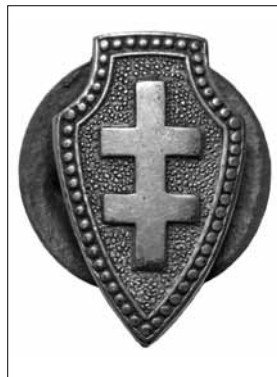
4 pav. Lietuvos šaulių sąjungos ženklelis. Nešiojamas ne rikiuotėje. Apie 1939–1940 m. pavyzdžio. Dydis – 18 x 11 mm LNM, M 969

Pagal 1937 m. kariuomenės vado patvirtintus Šaulių sąjungos ženklų pavyzdžius buvo išskirti tik narių, narių rėmėjų (raudono emalio) ir gar-