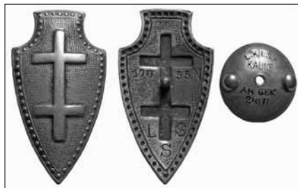
1.3 pav. Lietuvos šaulių sąjungos ženklas. Nešiojamas rikiuotėje. Po 1932 m. Nr. 17055. Dydis – 52,5 x 29 mm LNM, M 599