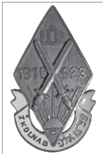
13 pav. Žydų karių, dalyvavusių Lietuvos nepriklausomybės atvadavime, sąjungos ženklelis. Dydis – 23 x 14 mm LNM, M 5343

Žydų karių sąjungos įstatai buvo įregistruoti 1933 m. spalio 17 d., nors veikti ji pradėjo dar 1928 m. Sąjungai priklausė per 2 tūkst. narių. Savo veiklą sąjunga nušviesdavo laikraštyje „Apžvalga“ (1935–1940 m.), tačiau žinučių apie narių ženklus jame aptikti nepavyko. Sąjungos ženklo ir vėliavos projektai buvo priimti 1934 m. (13 pav.). Tais pačiais metais buvo pagaminta ir gruodžio 9 d. iškilmingai įteikta vėliava 124 . Ženkleliai, matyt, buvo pagaminti kiek vėliau. 1938 m. spalio 23 d., švenčiant sąjungos 5 metų sukaktį, nusipelnusiems jos nariams buvo įteikti jubiliejiniai ženklai „Už nuopelnus Sąjungai“ 125 . Jų buvo įteikta per šimtą. Kaip rašo A. Astikas, jam šio ženklo matyti neteko 126 . Tad jis liko neaprašytas. 2013 m. išleistoje knygoje „Pažadėtoji žemė – Lietuva“ pateiktas Lietuvos centre niame valstybės archyve saugomas šio ženklo apdovanojimo pažymėjimas, kurio viršutinėje dalyje yra pavaizduotas ir pats ženklas (14 pav.). Įdomu, kad apie šių jubiliejinių ženklų realų egzistavimą iki šiol nieko nežinoma, be to, yra kitoks Žydų karių, dalyvavusių Lietuvos nepriklausomybės atvadavime, sąjungos ženklelis, apie kurį taip pat nieko nežinoma (15 pav.). Užsakytus ženklus pagamino Juozo Gerštyko graverių dirbtuvė Kaune.