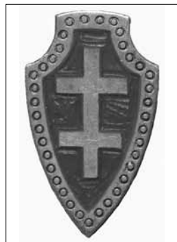
2 pav. Lietuvos šaulių sąjungos rėmėjo ženklelis. 1926 m. Šveicarija. Dydis – 19 x 11 mm LNM, M 5378