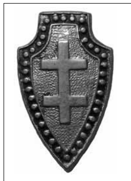
3 pav. Lietuvos šaulių sąjungos ženklelis. Dydis – 20 x 12 mm LNM, GRD 105091

Pirmajai grupei priskirti ženkleliai, kurių skiriamas bruožas – 38 taškai skydo apvade (3 pav.). Jie yra balto metalo arba žalvariniai. Šie ženkle-