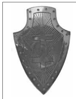
5 pav. Vytauto Didžiojo universiteto šaulių moterų korporacijos „Živilė“ ženklelis. 1935 m. Dydis – 20 x 13,5 mm LNM, M 5379