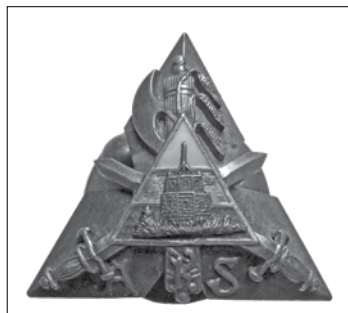
9 pav. Atsargos karininkų sąjungos ženklas. 1925 m.

Atsargos karininkų ženkleliai buvo dviejų dydžių – dideli (3,9 x 4,4 cm) ir maži (1,8 x 2,1 cm) 91 . Atsakymo, kas lėmė skirtingą ženklelių dydį, spaudoje rasti nepavyko. Tačiau, matyt, jų reikšmė nebuvo tokia pat kaip Šaulių sąjungos ženklelių. Ženklelių dydžio skirtumus turėjo lemti skirtingas gamybos laikas ir kaina. 1924 m. buvo numatyta, kad ženklas bus gaminamas iš aukso, sidabro, bronzos ir emalio. Preliminari nurodyta jo kaina – 35–45 litai, pradinis įnašas – 25 litai 92 . Ženkilai buvo pagaminti 1925 m. pavasarį, jų kaina – 40 litų 93 . Tai buvo ypač dideli pinigai 94 . Matyt, kad ne visi atsargos karininkai galėjo sau leisti tokias išlaidas. A. Astiko kataloge aprašyto didžiojo ženklo numeris – 7, mažojo – 148. Abiejų ženklų numeracija ir seka taip pat rodo, kad mažesnio ženklo atsiradimą lėmė mažesnė kaina. 1925 m. sąjungoje buvo tik kiek daugiau nei 120 narių. Jų skaičius ženkliu padidėjo tik po 1933 m. A. Astikas savo kataloge neįvardijo ženklelių