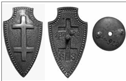
1.4 pav. Lietuvos šaulių sąjungos ženklas. Nešiojamas rikiuotėje. 1937 m. pavyzdžio. Nr. 18722. Dydis – 50 x 28 mm LNM, M 922