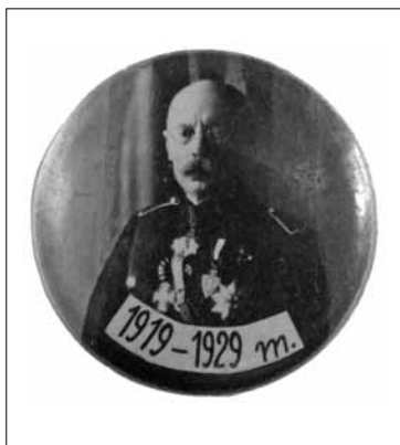
6 pav. Lietuvos šaulių sąjungos 10 metų jubiliejaus ženklelis. 1929 m. JAV (?)

1931 m. vasarą Šaulių sąjunga išleido ženklą „Už šaudymą“ 60 . A. Astikas šio ženklo nedatavo, tačiau nurodė, kad pagal 1933 m. statutą jis buvo