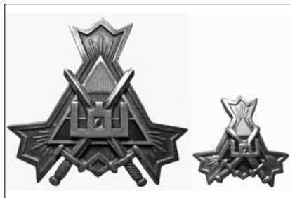
10 pav. Lietuvos kariuomenės kūrėjų savanorių sąjungos ženklas (1932 m.) ir ženkleli (1934 m.). Dail. J. Kaminskas. Dydis – 35 x 37 mm; 18 x 20,5 mm LNM, M 5380–5381

Dar vieną ženklelį Savanorių sąjunga išleido 1938 m. Rugsėjo 7–8 d. Kaune buvo sušauktas savanorių kūrėjų kongresas. Jame dalyvavo apie 6 500 delegatų. Visiems užsiregistravusiems nemokamai atminimui buvo išdalyti kongreso ženkleliai 107 . Šio kongreso ženklelis aprašytas A. Astiko kataloge 108 .