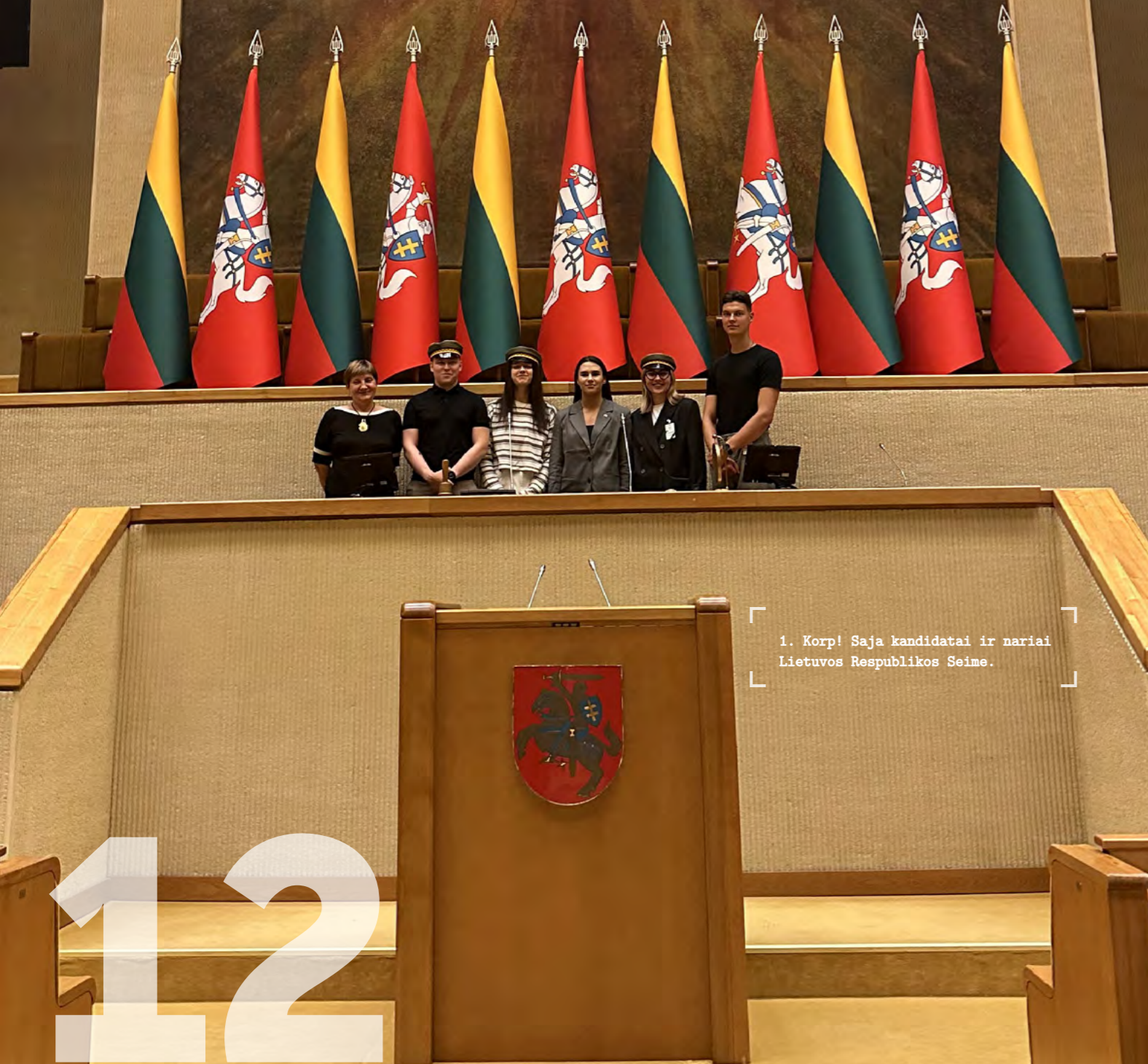
1. Korp! Saja kandidatai ir nariai Lietuvos Respublikos Seime.